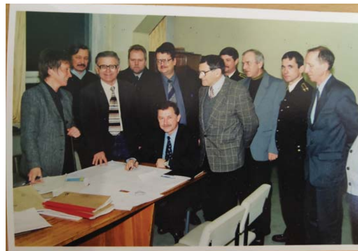
Ученые НИИ имени академика Крылова за работой